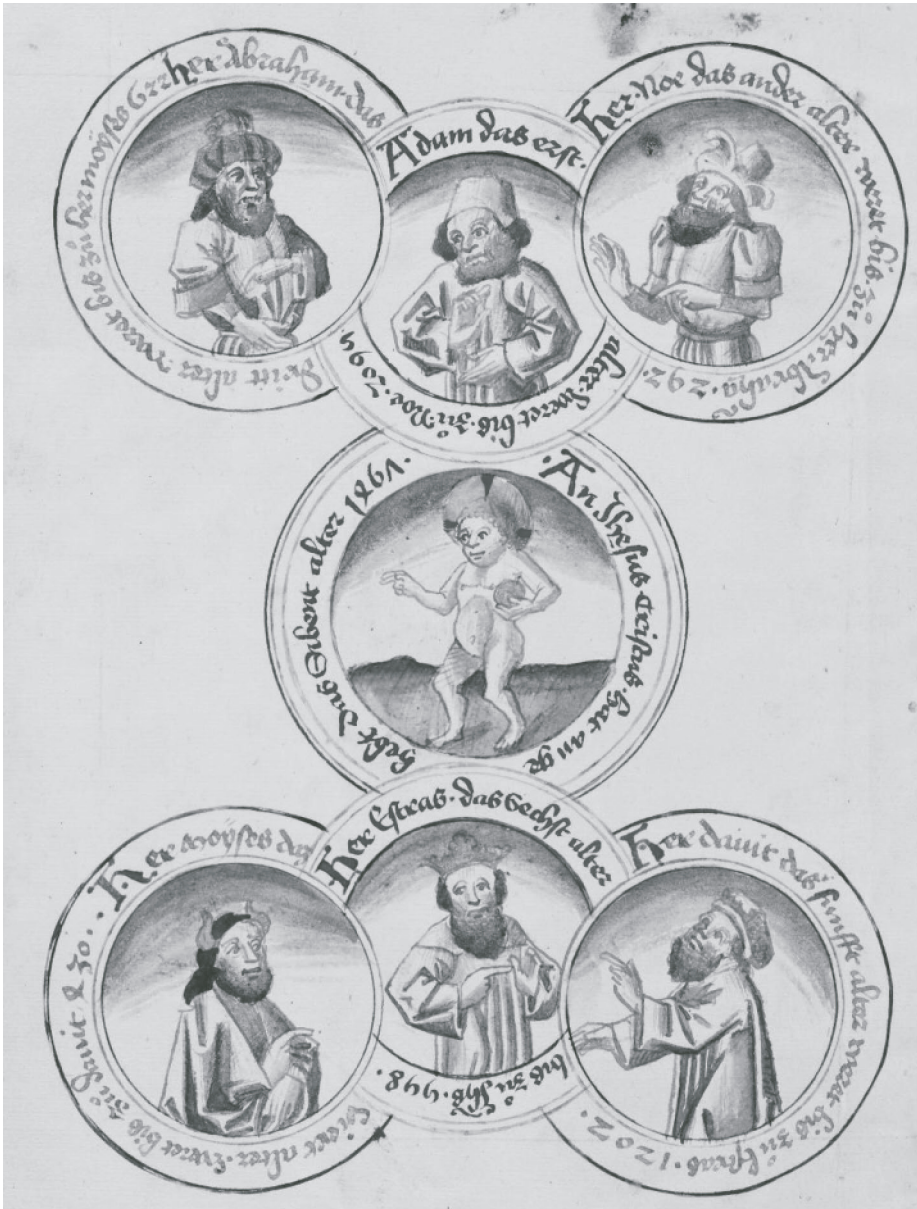
Jakob Twinger von Königshofen, Deutsche Chronik (Gmünder Kaiserchronik): Die sieben Weltalter

burg)); Heinrich BÜTTNER, Geschichte des Elsaß 1. Politische Geschichte des Landes von der Landnahmezeit bis zum Tode Ottos III. , Sigmaringen 2 (1991): 176 (künftig: BÜTTNER, Geschichte des Elsaß ).