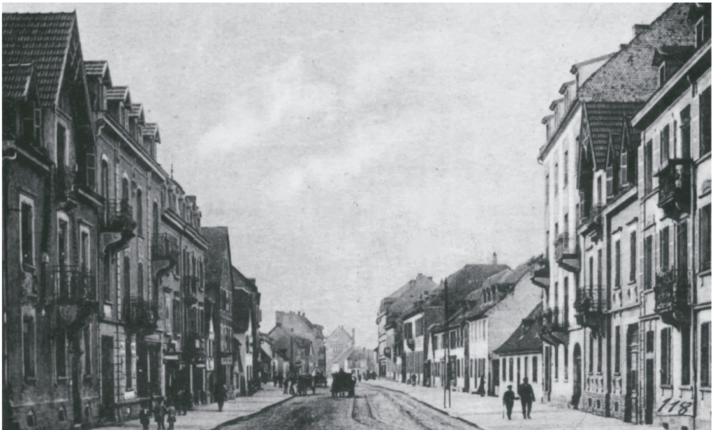
Königshofen im Elsaß, Römerstraße (historische Fotografie)

www.gesellschaft-elsass-und-lothringen.de